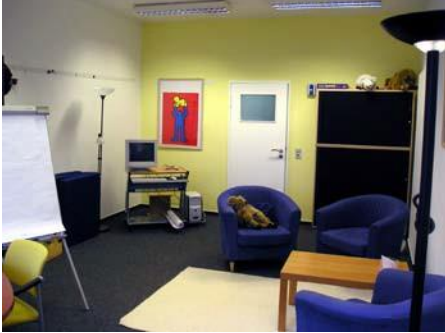
Therapieraum in unserem Ausbildungszentrum in der Innsbruckerstraße in Berlin