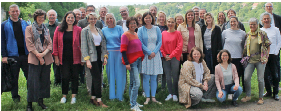
Die Leiter*innen unserer regionalen Ausbildungszentren