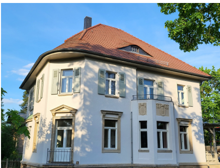
Unser Ausbildungszentrum in Dresden

Die praktische Tätigkeit findet in klinisch-psychiatrischen Einrichtungen statt. Sie umfasst unter anderem die angeleitete Durchführung von diagnostischen Erhebungen, Untersuchungen und Mitwirkung an psychotherapeutischen Behandlungen bei PatientInnen mit unterschiedlichen psychischen Störungen und Erkrankungen in unterschiedlichen Settings.